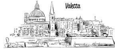
nach Valletta fahren