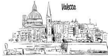
nach Valletta fahren