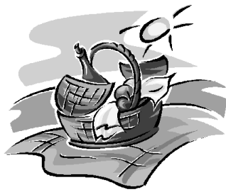
ein Picknick machen