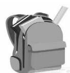
SAC A DOS