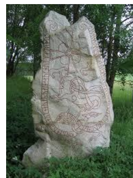
Sors B: Ġebbla dekorata

2.1 Għal xiex il-Vikingi kienu jużaw ir-Runi li jidhru f'Sors A?