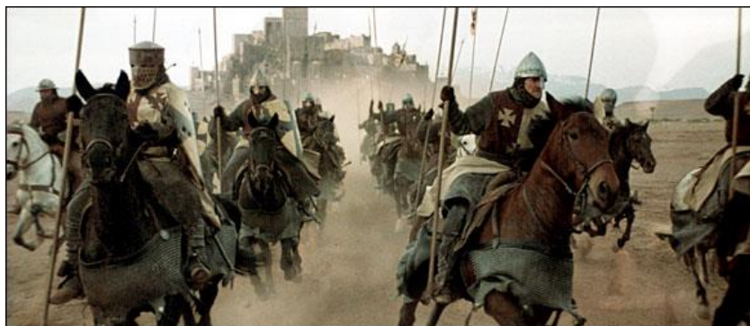
Sors G: Kavallieri sejrjn għall-Kruċjati

6. Hares lejn is-sors u wieġeb il-mistoqsijiet dwaru.